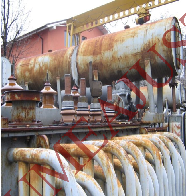
Fotografii ale produselor livrate în perioada 2002 – 2005 de la firmele din cadrul grupului FENE: identificare firmă LA ROCCA/ urme de degradare fizică